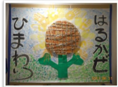
看多機はるかせの 大作 ←

今年の展示会では、昨年の展示会をみて『私も出してみたい!』と言われていた方が有言実行で出品されました。また『来年は私も出してみようかな』『来年何を出すか考えとかなん』など、意気込みを話される方が多数おられました。今からすでに来年の作品展示会が楽しみです。来年も、皆さんの力作の出展をお待ちしております♪