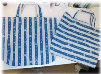
杏心の丘 2階 カウンター展示

軍手人形・肥後てまり・絵手紙・貼り絵・バッグ・アクリルたわしなどなど。すばらしい作品ばかりで、『買って来たものではないかしら?』とってしまうくらい。皆さんの手先の器用さや創造力に大感激でした。