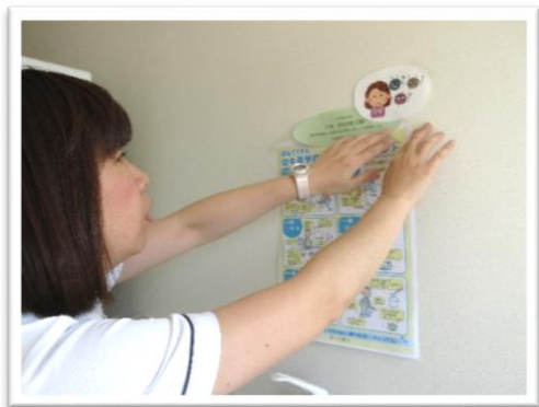
企画担当 外来診療部

爽やかな春が過ぎ、もうすぐどんよりした梅雨がやってきます。自然界では恵みの雨ですが、私達にはやや過ごしにくい季節でもあります。