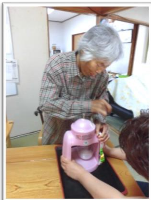
力仕事もなんのその。 氷かき、頑張ります